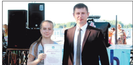
СТО НАГРАЖДЕННЫХ В ДЕНЬ МОЛОДЕЖИ