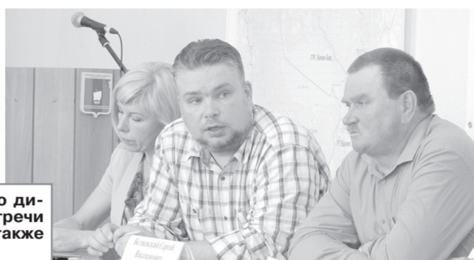
Небольшим коллективом следственного отделения ОМВД России по Шекснинскому району с начала года направлено в суд с обвинительным заключением 35 уголовных дел в отношении 44 человек.

составил почти 27 тысяч рублей. Наказание – 3 года 1 месяц лишения свободы в ИК строгого режима.