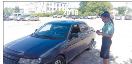
МАШИНУ АРЕСТОВАЛИ ЗА 17 НЕОПЛАЧЕННЫХ ШТРАФОВ

Шекснинская информационно-аналитическая газета