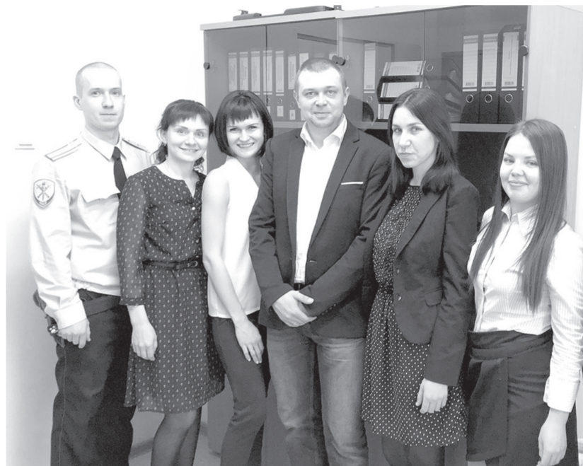
Небольшим коллективом следственного отделения ОМВД России по Шекснинскому району с начала года направлено в суд с обвинительным заключением 35 уголовных дел в отношении 44 человек.

составил почти 27 тысяч рублей. Наказание – 3 года 1 месяц лишения свободы в ИК строгого режима.