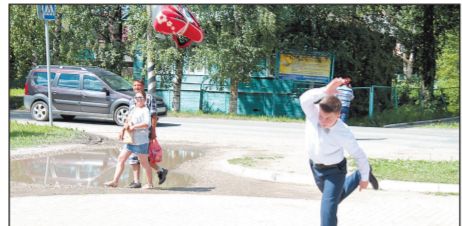
НОВЫЕ РЕКОРДЫ В МЕТАНИИ ПОРТФЕЛЯ