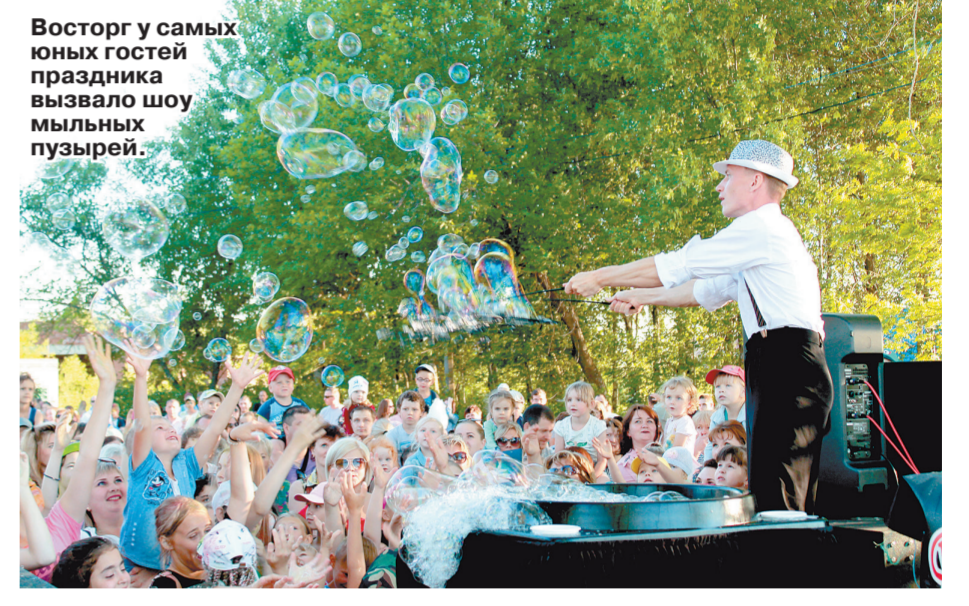
Восторг у самых юных гостей праздника вызвало шоу мыльных пузырей.