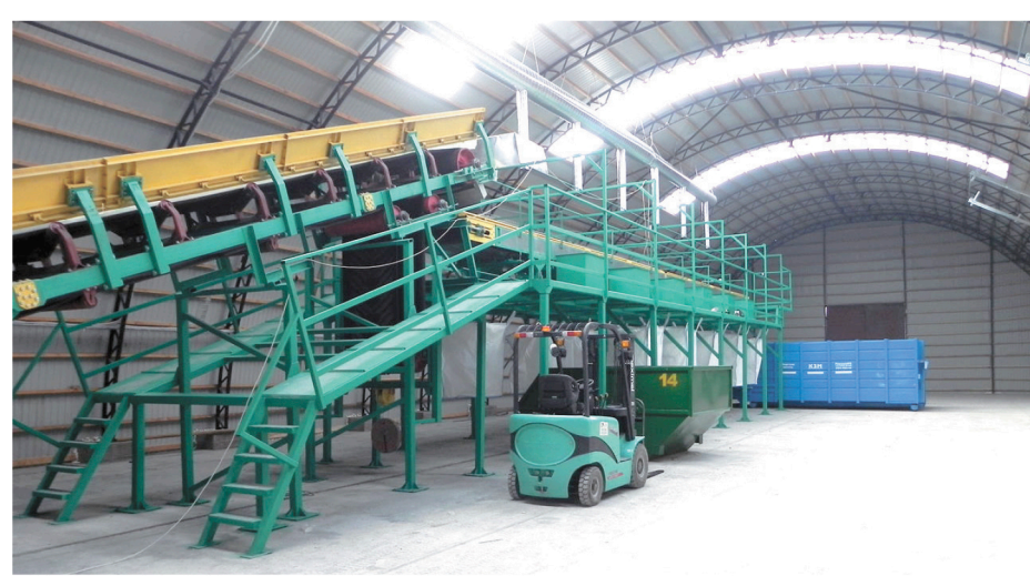
Завод работает с 2012 года и способен сортировать и уплотнять до 50 тысяч тонн мусора в год, а в цехе запланировано место под еще одну такую же линию.