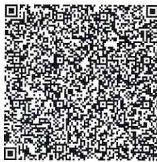
QR-код для оплаты