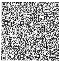
QR-код для оплаты