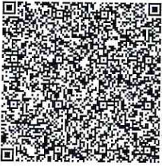
QR-код для оплаты