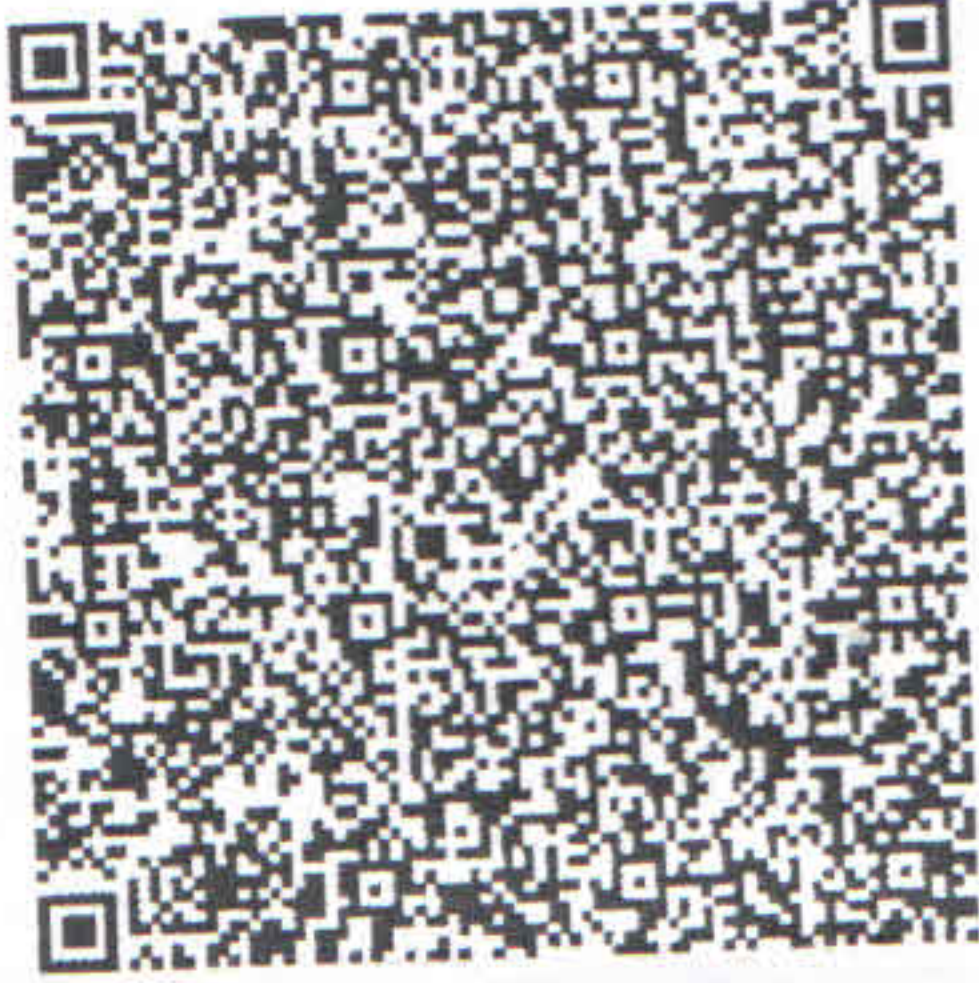
QR-код для оплаты

161250, Вашкинский р-н, с Липин Бор, ул Белозерская, д 18, кв 6 Платежный документ за февраль 2024г., лицевой счет 4598824448 на оплату услуги по обращению с ТКО