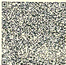
QR-код для оплаты