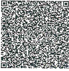
QR-код для оплаты