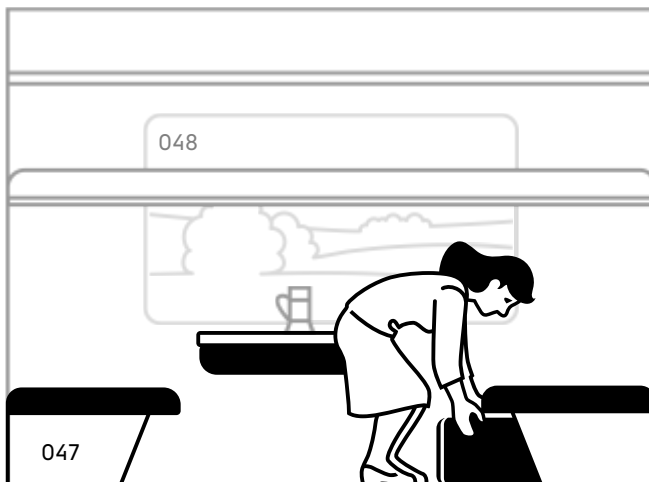
Багаж можно разместить под вашей полкой.

Подтверждаю, что с правилами и особенностями оформления, оплаты, возврата неиспользованного электронного билета, заказанного через интернет, и проезда по электронному билету, а также с офертой ознакомлен. Я согласен с реквизитами поездки и подтверждаю, что персональные данные пассажиров верны.