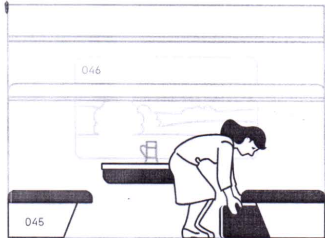
Багаж можно разместить под вашей полкой.

Выбирая поездку на поезде, Вы снижаете количество выбросов CO 2 на ~133.32 кг по сравнению с поездкой на то же расстояние на личном автомобиле