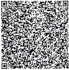
QR-код для оплаты