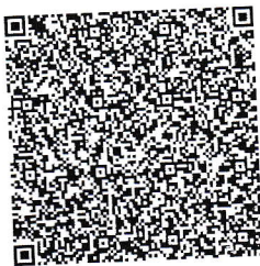
QR-код для оплаты

Региональный оператор по обращению с ТКО Общество с ограниченной ответственностью «Чистый След» Почтовый адрес: 162627, обл Вологодская, г Череповец, пр-кт Октябрьский д. 75А оф. 2 Телефоны: • +7 (8202) 201-901 по вопросам заключения договоров, начислений, перерасчетов • +7 (8202) 643-644 по вопросам вывоза ТКО в Череповце • +7 (921) 254-36-44 по вопросам вывоза ТКО в районах Электронный адрес: сайт: www.sled35.ru, почта: info@sled35.ru Офисы обслуживания: г. Череповец; пр-кт Строителей 28А Режим работы: пн., ср.: 8:30 - 12:00; вт., чт.: 13:00 - 17:30; пт., сб., вс.: выходной Реквизиты: ИНН/КПП: 3528213203 / 352801001, р/с: 40702810620010000050, банк: АКБ "ДЕРЖАВА" ПАО г. Москва, корсчет: 30101810745250000675, бик: 044525675